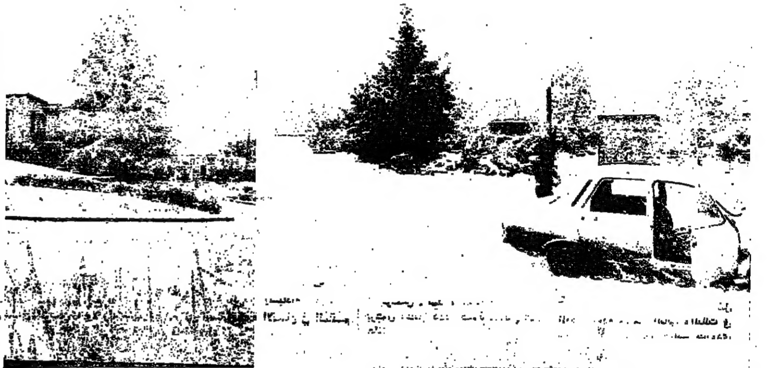
■ اللوج هو الحاضر الوحيد ■

واضافت : املي كبير في مدينتنا هذه الرسالة لتحقيق تقدم وازدهار هذه الابنية ونموها ، بالاضافة الى وحدة جميع طوائفها الاجتماعية بروح الاخوة والتضامن .